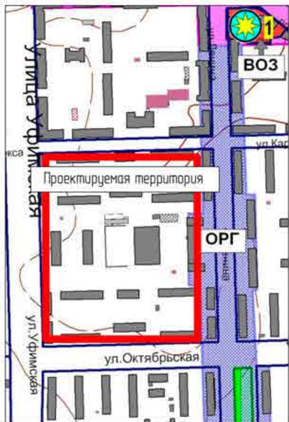
Схема градостроительного зонирования в части границ зон особого регулирования градостроительной деятельности

ОРГ – зона особого регулирования градостроительной деятельности