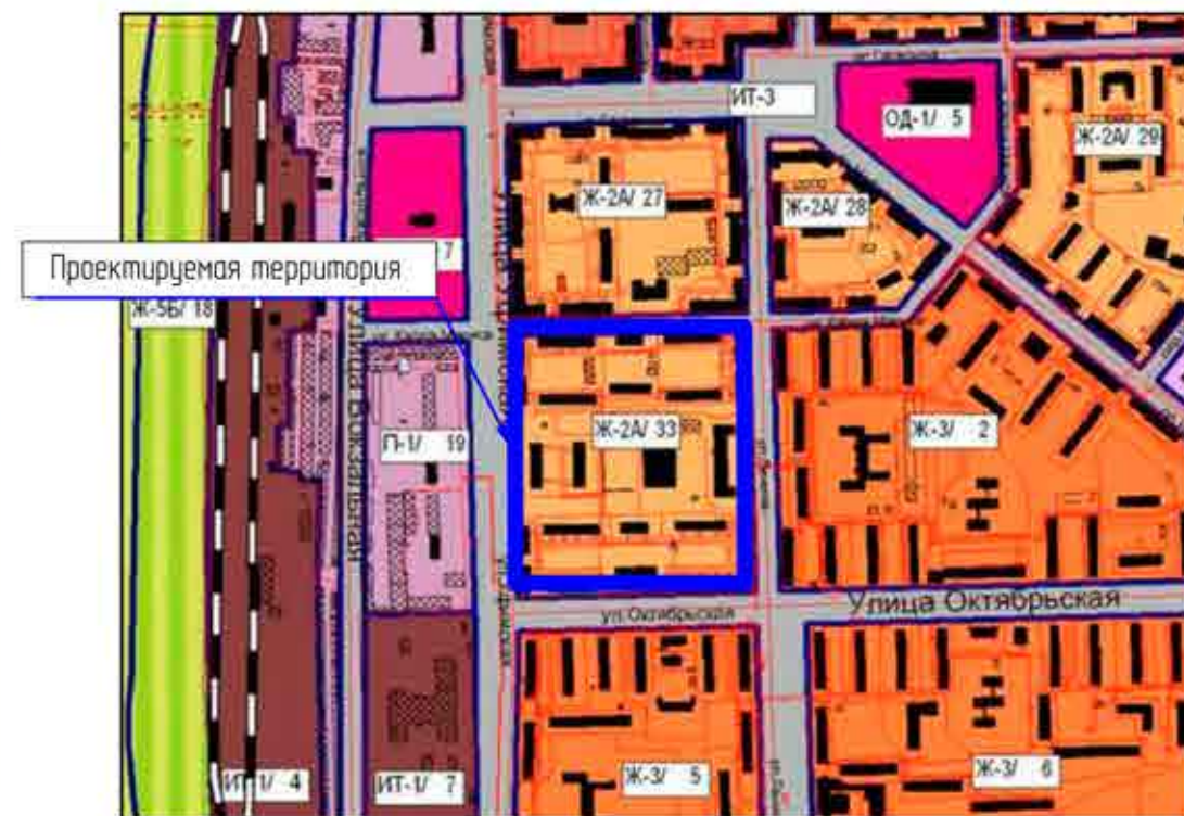
Схема градостроительного зонирования составлена на основании приложения 1 Правил землепользования и застройки городского округа город Салават Республики Башкортостан утвержденных решением Совета городского округа город Салават Республики Башкортостан от 05 февраля 2016 года №3-54/638