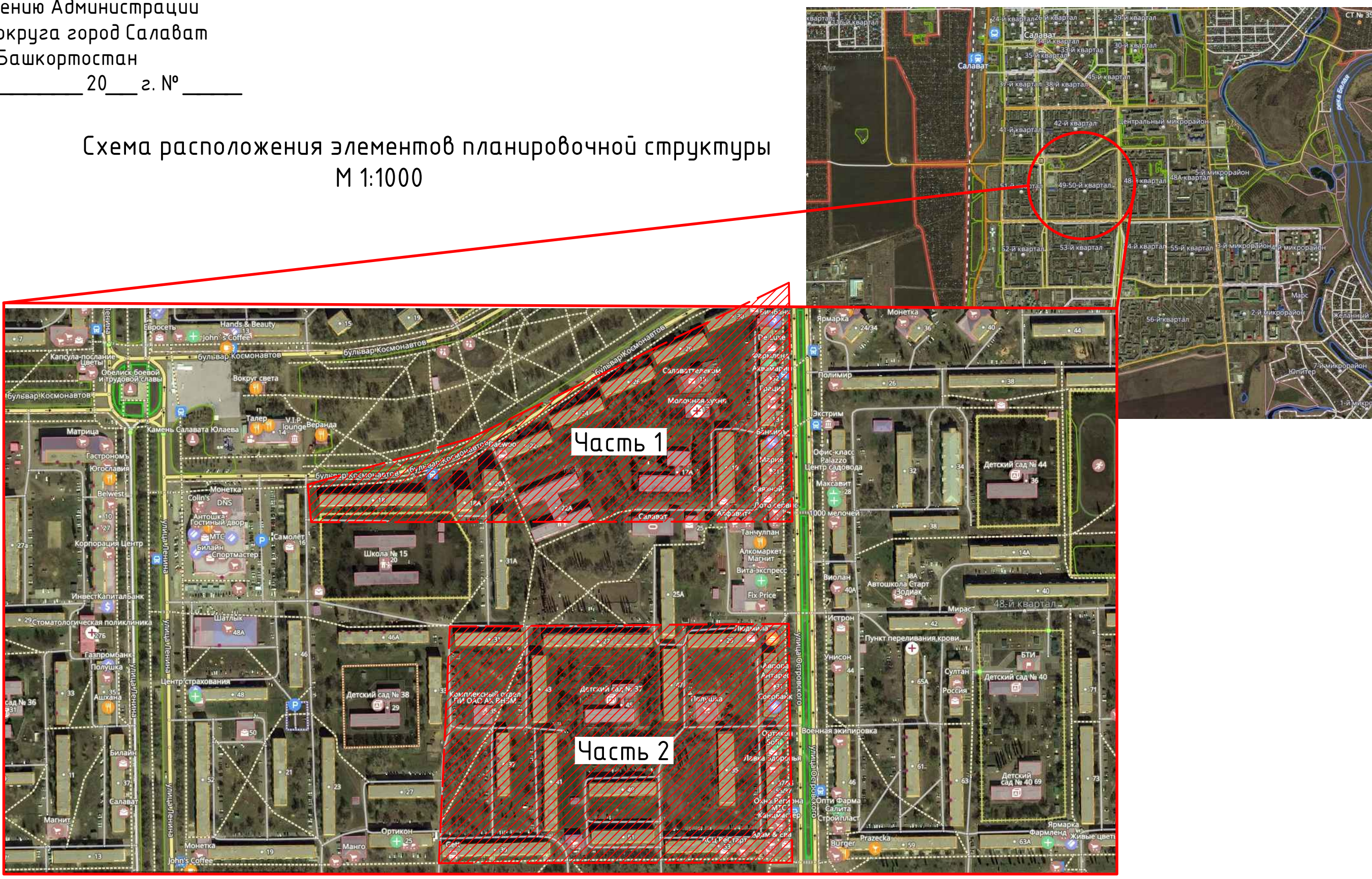
Схема расположения элементов планировочной структуры М 1:1000

Приложение №2 к постановлению Администрации городского округа город Салават Республики Башкортостан от " " 20 г. №