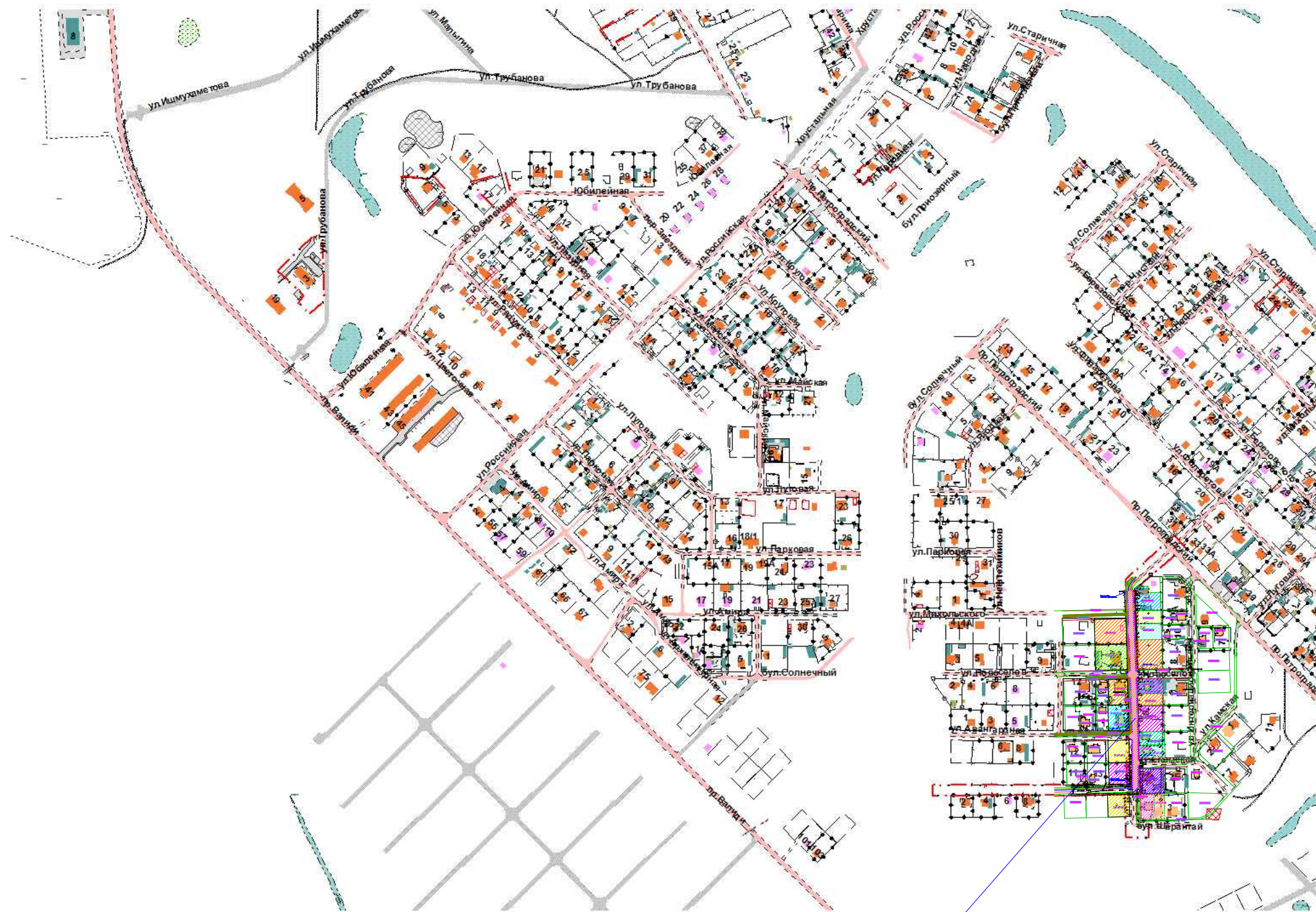
Границы зоны размещения линейного объекта (строительство автодороги по ул. Вишневая)